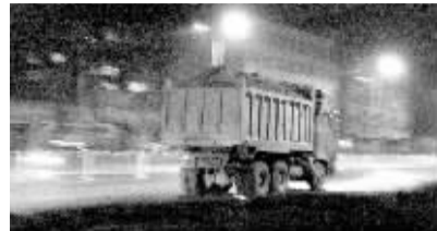
深夜的郑州街头,无牌垃圾车奔驰的身影经常可见。