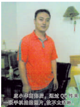
应小华离郑后,通过QQ传来一张手机拍的照片,做不太清晰。