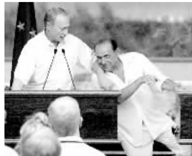
2003年8月29日,贝卢斯科尼在意大利萨丁岛会见俄罗斯总统普京(左)时差点摔倒。

据新华社电 刚刚赢得议会选举的意大利当选总理西尔维奥·贝卢斯科尼15日说,西班牙新内阁“脂粉气过浓”,首相会遇到麻烦。西班牙执政的工人社会党随后反击,建议贝氏新内阁也应多用女性。