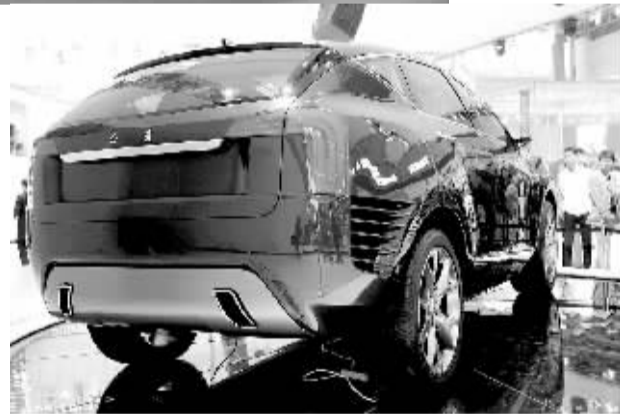
▼红旗SUV是中国第一汽车集团倾力打造的又一杰作。

经过长时间筹备,第十届北京国际汽车展览会20日正式拉开帷幕(28日结束),在接下来的几天时间里,将有70万观众及众多国内外专业人士享受这场两年一届的“饕餮”盛宴。按照组委会安排,本届车展从22日早9时开始对公众开放。