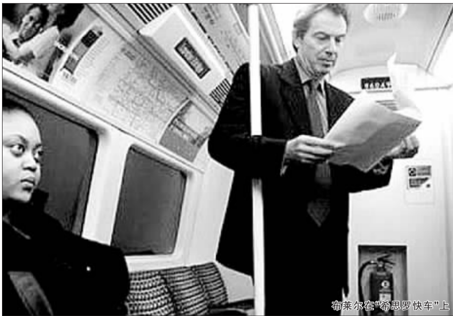
布莱尔在“希思罗快车”上

公司方面正在联系当事男售票员,向他了解情况。“我们的经营策略是,无论什么身份,人人都得买票乘车。如果售票员的确实收票款,我们将展开调查。”他说。