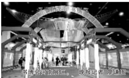
书博会河南展区。

4月27日 15:10~17:00,健康管理大师林海峰个人讲座暨新书《做最健康的自己》签售会在中原图书大厦举行。