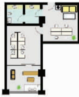
B户型 面积约75m 2