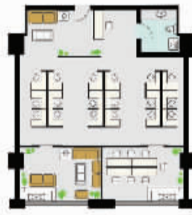
G户型 面积约100m 2