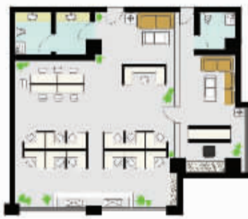
F户型 面积约140m 2