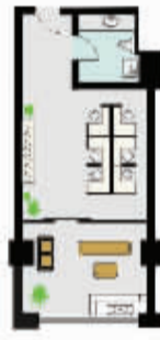
C户型 面积约50m 2