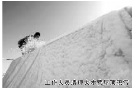
工作人员清理大本营屋顶积雪

为确保万无一失，火炬登顶将选择北侧的传统路线。此前，中国登山队曾多次尝试登顶珠峰，并在峰顶点燃“祥云”火炬。从大本营至顶峰距离为48公里，按照以往经验，如果一切条件具备，登山队应该在4天时间内就能登顶，但气候条件将成为决定这一时间的重要指标。按照北京奥组委的承诺，奥运圣火登顶后，