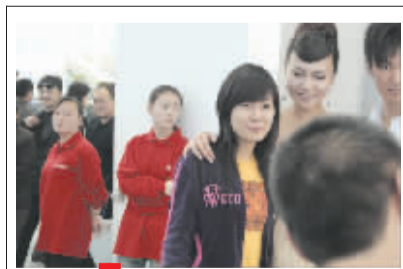
车展上的红衣清洁工 MM

“‘人肉搜索’引擎”只是网络社会刺向现实世界的一根探针，却凶悍异常，这一点虐猫女、很黄很暴力女生、陕西省林业厅人士一定深有所感。但“‘人肉搜索’引擎”的发力者其实是最普通的网民，他们大多没有进化到 Avatar（源自印度梵语，本意是指“分身、化身”；互联网时代，Avatar 成为网络虚拟角色——网络用户在以图像为主的虚拟世界中的虚拟形象的代名词，通常为卡通形象）阶段，对赛博空间（Cyberspace，即互联网的“虚拟世界”）的生存规则也并不熟悉——或者他们根本不关心。之所以在现实世界能产生巨大的反响，根本原因还在于现