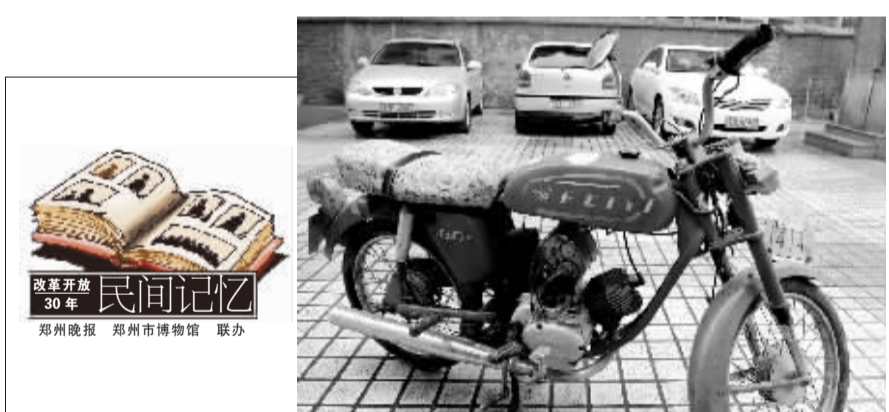
改革开放 30 年 民间记忆 郑州晚报 郑州市博物馆 联办