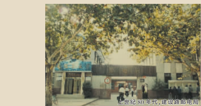
上世纪80年代,建设路邮电局

进入民国后,邮差运递的工作量更大了,加之兵荒马乱,其艰辛、危险可想而知。每天天不亮就上路,夜行还要准备晚饭带在身上,用洋油灯笼照明,将铁皮饭盒搁在灯笼上,利用灯笼的余热保温。由于负重增加,许多没做过苦力的邮差就有些吃不消,肩膀一次次被扁担磨破,血水、汗水浸湿了邮包,直到磨硬不再破。因此,大多数老邮差的肩膀上都会留下一道道的伤疤。