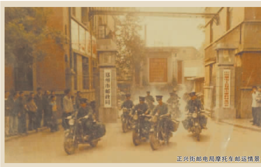
正兴街邮电局摩托车邮运情景

从“一根扁担两根绳,一盖马灯两只铃”的步班信差,到如今现代化武装的邮运,中国邮政百年来发生了沧桑巨变。历经“大清邮政”、“中华邮政”、“人民邮政”,漫漫邮路上发生了多少不为人知的故事呢,本期城市故事带您走近郑州邮政那些渐行渐远的记忆。 晚报记者 苏瑜 实习生 任中敏/文图