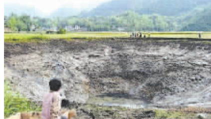
池塘已水干见底,塘底留下黑色淤泥