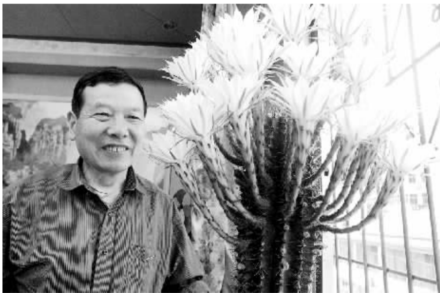
养了 10 年的仙人掌一次开满花，让主人乐坏了。