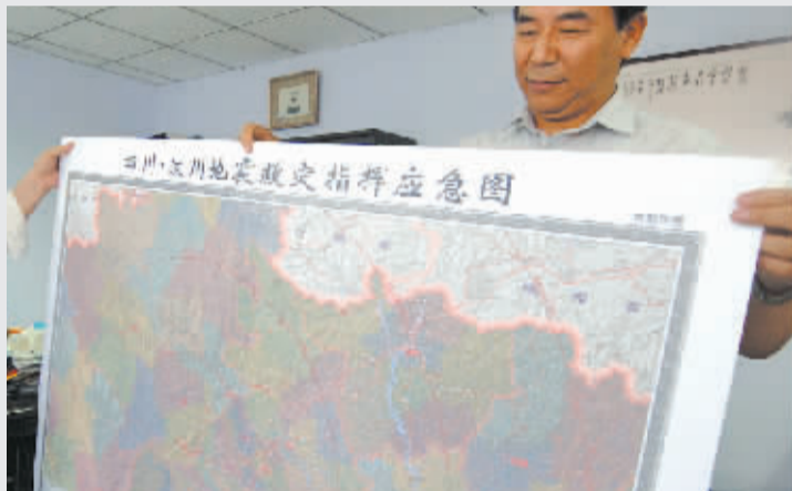
5月15日,河南省地图院工作人员展示刚制作完成的汶川应急地图。

今日0时本报收到最新消息,200名特警已于昨晚6时30分徒步到达汶川县漩口镇,展开全面救援工作。