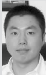
郑州亿国金顺房地产开发有限公司总经理 管营