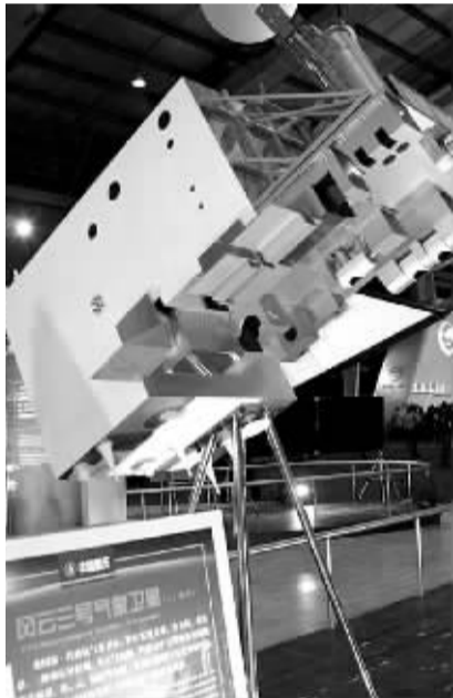
珠海航展上的风云三号气象卫星模型