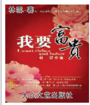
大雪 著 大众文艺出版社

开席时，李伟举杯祝词，说：“今天，我这桌酒席是为了欢迎我最爱的姐姐和我们的好友叶子小姐而设的，祝她们来北海玩得开心。”