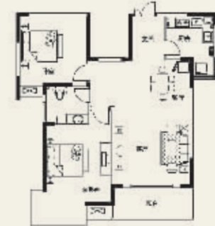
D 2R# 2房2厅1卫(西单元) 86.87m 2