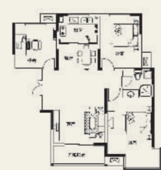
D 1R# 3房2厅1卫 109.65m 2

康桥·上城品，强调居住感受的同时更注重居住的行为方式，优雅之中流淌着后者的尊贵与荣耀。除遵循科学功能外，亦探寻居住生活的深层与内在品质。创造做的内庭院与大阳台，让居室吸纳自然万象；拐角飘窗，穿透全羽，带来安逸的考究质感。来自国际大师灵感的空间组合，源于对生命至高尊重的点滴细节，恰是值得珍藏一生的艺术品。 温馨二居：细腻完美居家，精致优雅生活，巨大主卧外升270°飘窗，自我空间奢华展现，尽显主人尊贵奢华。 阔绰三居：领袖气派，君临气势。大客厅、大阳台，采光纳气，健康引领居家。私家花房、收藏室、休闲阁，打造自由王国。