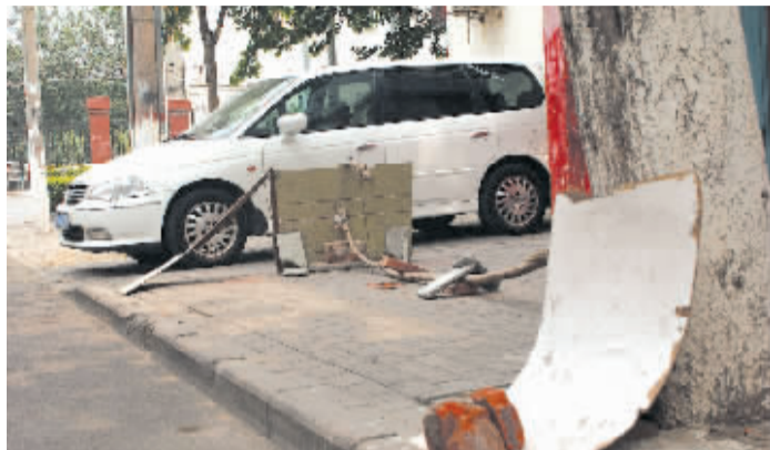
市民用木板制作障碍物阻挡车辆在门前停放