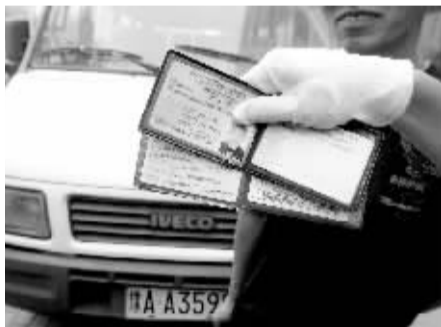
司机谢某后悔不已。