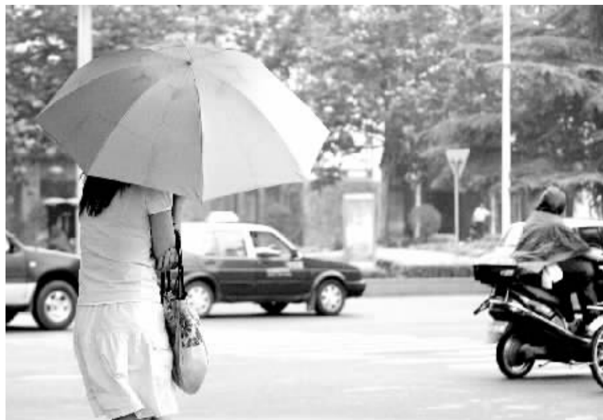
昨日,飘扬的小雨中,一名撑伞的女孩蜷缩着身体从中原路走过。