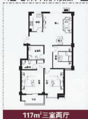
117m 2 三室两厅