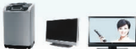
示意图, 奖品以实物为准