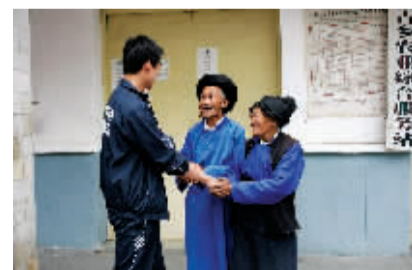
信号开通后,色尔古乡的村民向郑州移动通信保障分队的队员表示感谢。

大爱无疆,移动有情。在灾难和艰险面前,在利益和责任面前,许许多多的企业公民都能选择大义、勇于担当。郑州移动正是这样一个有着爱国之心的企业公民,以优质的通信技术支持、迅速及时的应急保障、不畏艰险的勇敢品质,以大爱、大义为灾区人民搭建信息通道,为灾区奉献赤诚爱心,相信这份援助可以到达灾区人民的心灵深处,令人在感动于“正德厚生 臻于至善”的力量的同时,也发现移动通信服务的进步。