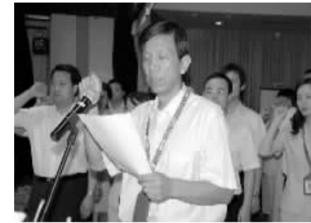
郑州移动党员宣誓

6 月 27 日，为庆祝中国共产党建党八十七周年，郑州移动给公司的党员干部们组织了一场别开生面的党课，不仅表彰了一年来郑州移动公司的先进集体和个人，还举行了一场抗