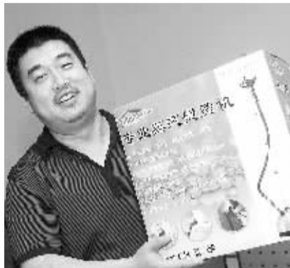
提供《免费“浪漫”后,老两口被忽悠6000元》线索者获挂烫机。

许先生告诉记者,当父母吞吞吐吐讲述了内情后,他开始仅感到骗子的手段很“高明”,后来他仔细想了想,为什么受骗的多是