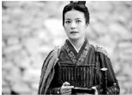
孙尚香说出了千年之后的名句

暑期强档电影《赤壁》即将上映,预告片也密集曝光,其中有一段孙权的妹妹孙尚香与诸葛亮之间的对话,孙尚香说出了“天下兴亡,匹夫有责”这8个字,然而,这句话其实是出自明末学者顾炎武的著作。东汉末年的人物,却脱口说出了明代人物的名言,整个时空错乱了1400年。