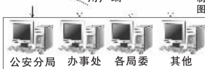
公安局 办事处 各局委 其他

完毕。坐在总控制台前,中原区信息数字化指挥中心负责人苏海涛介绍了它的构成和效率。比如:以前有犯罪嫌疑人在汝河路与桐柏路口作了案向北跑,警方接警后,先得要汝河路办事处监控中心注意自己的路口,嫌疑人如跑过汝河路,警方就要通知绿东村办事处监控系统看此人的位置;再向北分别要通过林山寨办事处、建设路办事处、棉纺路办事处、桐柏路办事处或者各局委。“因为中间有间断,警方需到各办事处协调,到时还不一定能监控到人,可能最后到办事处提取资料。而这个中心建成后,各办事处都统一的平台上,平台随时与中原公安分局双向对接,对整个桐柏路实现相互监控,警方可随时监控嫌疑人,并通知民警迅速抓获嫌疑人,不至于让他跑掉。效率可想而知。”