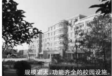
规模宏大,功能齐全的校园设施。

7月12日、26日,8月9日、23日上午10点在郑州市商贸外语学校举办“招生说明会”,欢迎家长学生预约参加。该校的系列报道将于每周二的《第一教育》、周五的《第一校园》进行刊登,敬请关注。