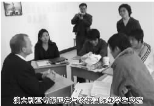
澳大利亚专家正在与该校国际部学生交流

中招考试450分左右的学生要想进入重点高中,家长要交择校费几万元。学生进校后,心理压力,丧失了自信,高考勉强上个三本或大专。算下来高中连同大学家长需要投入十几万元的资金,毕业后淹没在人海里,工作都难找。一部分家长想把子女送到海外留学,由于英语成绩门槛以及几十万元甚至上百万元昂贵的学费,让绝大部分家长望洋兴叹。如何顺利留学、就业、移民始终困扰着雄心壮志的学生和家长。风景秀丽、气候适宜、资源丰富而人口稀少的澳大利亚是世界上急需技术人才的国家之一。如果拿到TAFE学院政府急需的职业文凭,工作2年后即可办理移民,享受澳洲高福利,以最低工资计算,年薪不低于4万澳币,相当于人民币25万元。除去基本生活费以外,每年可节省十几万元。赴澳留学必须具备三个条件:高中或中专毕业证;雅思成绩5.5分以上;两年20万元的学费和生活费。入读我校中澳班,采用小班授课,海外大学教学督导,班主任严格管理,全程关爱,全面突破语言文化等留学障碍,全程可控,稳妥过渡。学校推出该项目后,立即引起许多学生家长的关注,接到咨询电话2000多个。有一位给儿子报名的家长感慨地说:“这种教育模式真是比上高中更有前途的选择呀!孩子的前途有了保障,就不怕毕业就失业了。”