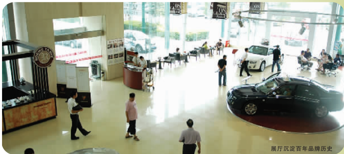
展厅沉淀百年品牌历史