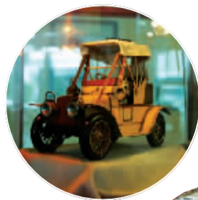
世界第一款罗孚汽车的模型

历史、品牌、品位、优雅……这些词汇,都可以在这个不大的展厅里真实地感受到。 晚报记者 陈栋