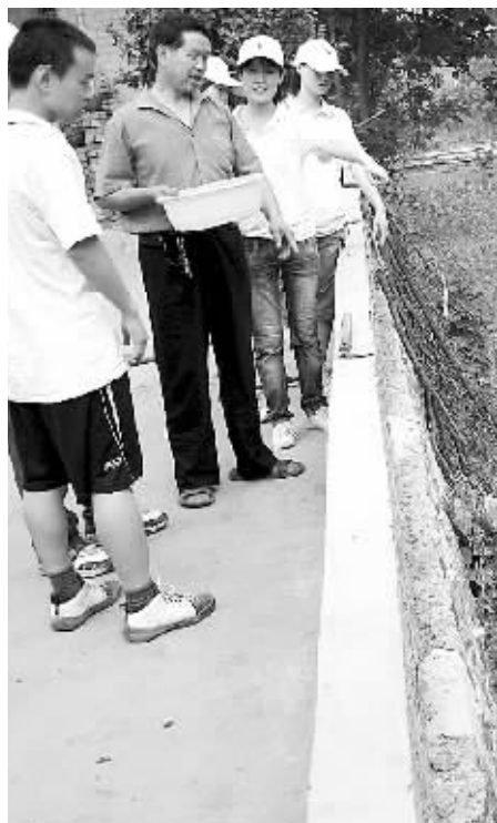
师生劝阻村民向河道倾倒污水

为共度今夏缺电难关,尽量减少限电损失,新郑市供电公司向全市发出节电倡议,建议减开路灯照明,关闭夜景亮化、广告霓虹灯及装饰灯,8时至21时之间工业企业错峰用电,让电于民,确保城乡居民生活用电。提醒居民作好停电准备。