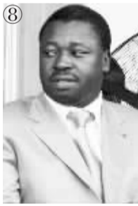
多哥总统:福雷·埃索齐姆纳·纳辛贝 生日:1966年6月6日 掌权日:2005年2月5日 权力之路:父亲的栽培

早年毕业于基辅国际关系学院,后就读于美国乔治·华盛顿大学和哥伦比亚大学,获得两个法学学位。1995年学成回国并当选为议员。2003年11月,格议会选举“舞弊”风波迫使总统谢瓦尔德纳泽下台。反对党将萨卡什维利推举为新总统候选人。2004年1月4日,他在总统选举中获胜。今年1月20日,他再次宣誓就职。