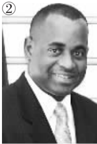
多米尼克总理:罗斯福·斯凯里特 生日:1972年6月8日 掌权日:2004年1月8日 权力之路:正确的时候正确的人去世了

吉格梅是不丹10位王子和公主中最年长的,曾在美国和英国学习,获得英国牛津大学政治学硕士学位。今年3月,不丹举行了议会选举。这位年轻潇洒的国王保持国家元首的身份,他将指导不丹民主化进程。