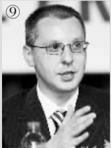
保加利亚总理:谢尔盖·斯塔尼舍夫 生日:1966年5月5日 掌权日:2005年8月17日 权力之路:他精心策划了向上爬的轨迹

2005年2月5日,其父埃德马总统突发心脏病去世后,多哥武装部队随即宣布把权力交给福雷。迫于国际社会的压力,他上任20天后便下台了。但是随后福雷再次当选总统并引发了国内暴力冲突。