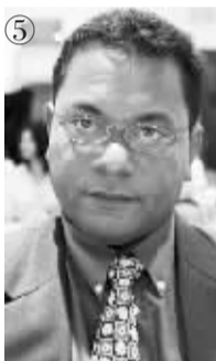
瑙鲁总统:马库斯·斯蒂芬 生日:1969年10月1日 掌权日:2007年12月19日 权力之路:前任遭到了弹劾

作为业余拳击爱好者的他2006年取得了经济学的硕士学位。2003年开始,他一直担任“马其顿内部革命组织——国民团结民主党”主席。2006年7月5日,该党赢得了议会选举,8月25日,他的政府上台。