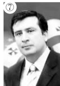
格鲁吉亚总统:萨卡什维利 生日:1967年12月21日 掌权日:2004年1月25日 权力之路:领导“玫瑰革命”

18岁生日过后6天,恩史瓦帝就戴上了皇冠。2001年,恩史瓦帝规定18岁以下的女性禁止与异性发生性行为。该禁令有效期为5年,颇不得人心,尤其是当恩史瓦帝本人娶了年仅17岁的新娘之后,便不得不被取消了。