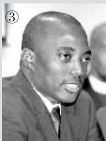
刚果(金)民主共和国总统:约瑟夫·卡比拉 生日:1971年6月4日 掌权日:2001年1月26日 权力之路:总统父亲被谋杀

多米尼克工党成员,在老部长罗斯福·道格拉斯去世后,接替他出任教育部长。当前总理因为心脏病猝死,他接任总理,并很快当选为多米尼克工党主席。此时他年仅31岁。