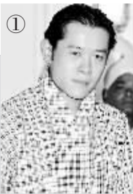
不丹国王:吉格梅·凯萨尔·纳姆耶尔·旺楚克 生日:1980年2月21日 继位日:2006年12月14日 权力之路:父亲传位给他

如果47岁的奥巴马能赢得美国大选,他将成为美国史上最年轻的总统之一,但全世界年纪轻轻就登上权力巅峰的还大有人在。美国杂志就列举了10名全世界最年轻的国家领导人。