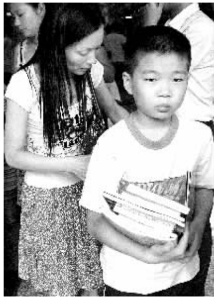
昨日下午,消费者抱着图书出门。该书店已经不再提供免费塑料袋。

本月10日,商务部、国家发展改革委和工商总局再次就限塑令发出了相关补充意见,限塑令范围扩大至全部零售服务场所。而环保布袋、塑料购物袋、食品预包装袋等也将被要求明确标注生产厂家厂址等信息。郑州市工商局市场处效忠忠处长介绍,他们已经关注到了最新的政策,已向基层工商部门提出了新的工作要求,最近将召开专门会议布置工作。 晚报记者 辛晓青 实习生 赵冠霞/文 王梓/图