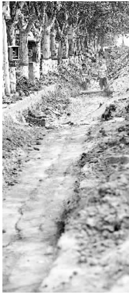
正在施工的嵩山路