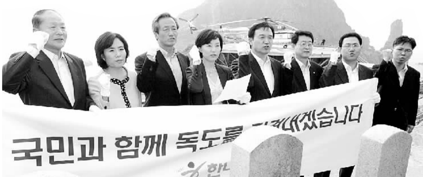
14日,韩国政府官员在独岛为在捍卫独岛战斗中死去的人修建的纪念碑前高喊口号。

韩国方面7月14日强烈抗议日本文部科学省在当天公布的中学教科书指导手册中将独岛(日本称“竹岛”)表述为日本领土。韩国官员称日本此举“不可容忍”。尽管日方呼吁双方冷静,但被激怒的韩国政府已决定召回驻日大使。