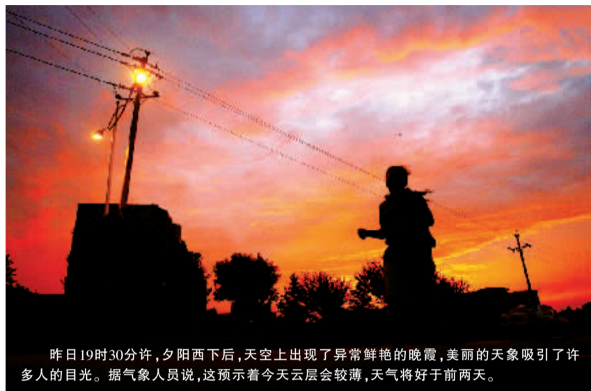
昨日19时30分许,夕阳西下后,天空上出现了异常鲜艳的晚霞,美丽的天象吸引了许多人的目光。据气象人员说,这预示着今天云层会较薄,天气将好于前两天。