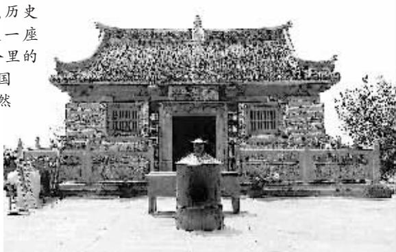
始建于汉代的始祖山上的轩辕庙,2006年被国务院列为国家级重点文物保护单位(资料图片)

阅读始祖山,我们发现,它本身就是一部读不完的历史教科书,就是一轴风云际会、群星璀璨的英杰谱!