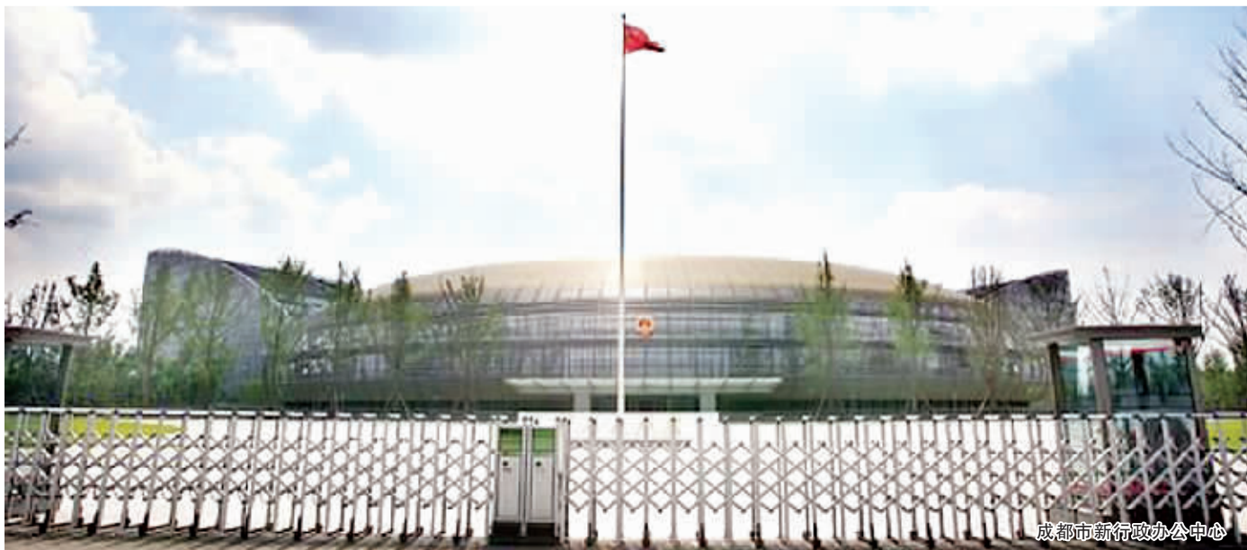
成都市新行政办公中心