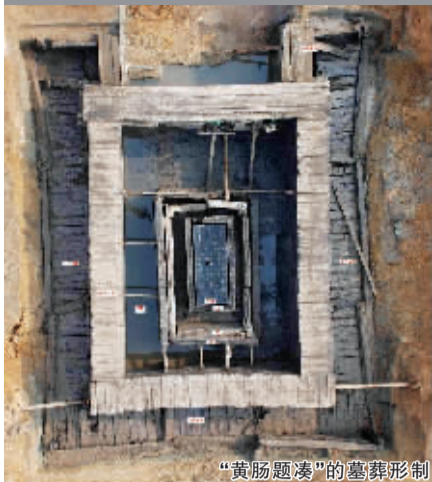
“黄肠题凑”的墓葬形制

一直以来,安徽省西部的六安市双墩村村外的土墩就被当地的老人传说是古墓。2006年年初,为配合合肥至武汉的铁路建设,文物部门决定即刻对这片传说中的墓地实施勘察。一时间往来于这里的车辆和机械的轰鸣声,让这个昔日偏僻而宁静的小村庄热闹了起来。