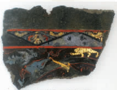
墓葬内的金箔玉器