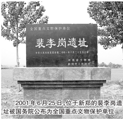
2001年6月25日,位于新郑的裴李岗遗址被国务院公布为全国重点文物保护单位

3个多月过去了,在裴李岗村这处遗址上试掘开挖了5条探沟,试掘面积118平方米,发现8座墓葬,5个灰坑。共出土石器25件,陶器21件,骨器1件,兽骨2件,绿松石珠2枚,这是裴李岗遗址第一次科学发掘得到的实物资料。从现场出土的陶器来看,所发现的陶器仅有红褐色砂质陶和泥质陶两种,均为手制,因此胎壁厚薄不匀,这与之前在仰韶文化里发现的彩陶明显不同,这些陶器更接近原始状态,初步推测是早于仰韶文化的先民所遗留下来的器物,而仰韶文化处于新石