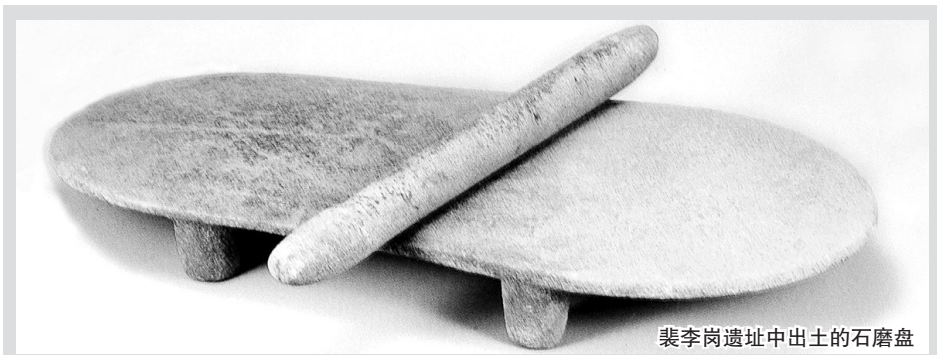
裴李岗遗址中出土的石磨盘

如今,站立在裴李岗遗址放眼四望,依然是郁郁葱葱的树木,依然是四野辽阔的农田,依然是炊烟袅袅鸡犬相闻的祥和小村,似乎是不变的生活,依然是不变的日月星辰,但谁又能想到,转眼已过了万年呢。