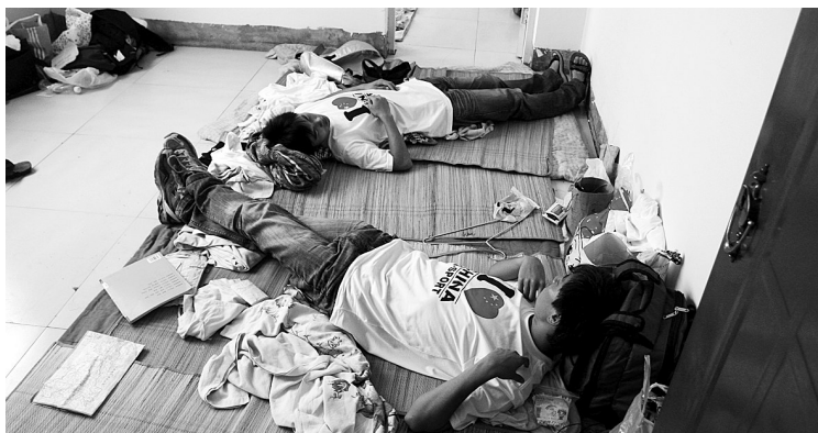
整天在郑州来回奔波，两名同学的确有些累了，一回到住的地方，就躺下睡着了。