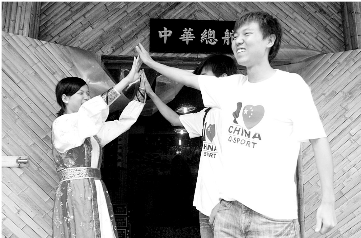
两名男生 昨天请假，来到 一名女生打工的 饭店，为她加油 鼓励。