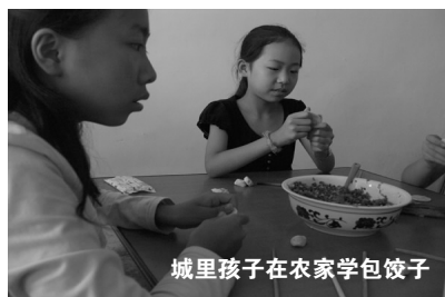
城里孩子在农家学包饺子

7月20日,郑州晚报社与河南全球通旅行社联合推出的“凤凰山吃苦夏令营”第二期开赴新密凤凰山景区,几天来,他们有哭,有笑,有兴奋,也有痛苦,他们正以一种不同寻常的方式度过这个暑假。