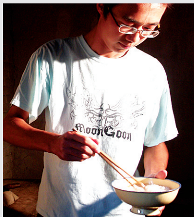
妈妈在外面打零工时,如果他在家都是他做饭。