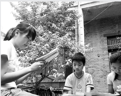
大学考了个高分,村里的孩子都前来求教。