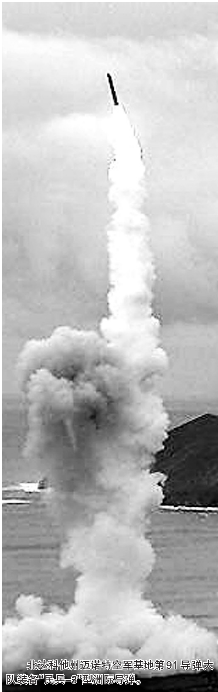
北达科他州迈诺特空军基地第91导弹大队装备“民兵-3”型洲际导弹。