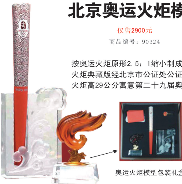
奥运火炬模型包装礼盒

按奥运火炬原形2.5:1缩小制成 火炬典藏版经北京市公证处公证 火炬高29公分寓意第二十九届奥运会