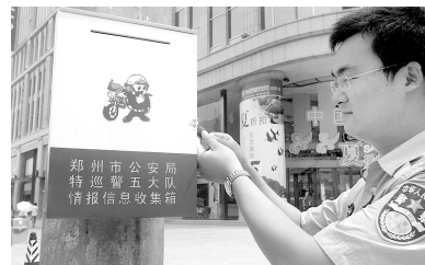
民警正在打开农业路与花园路交叉口东北角的“情报信息收集箱”。