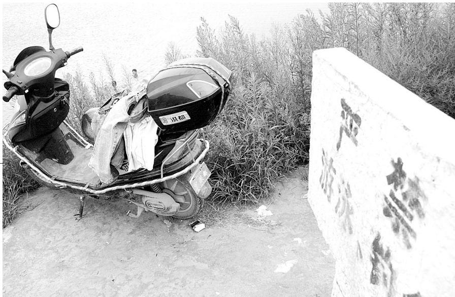
昨日上午,常庄水库岸边竖立着禁止游泳的牌子,依然有人下水游泳。