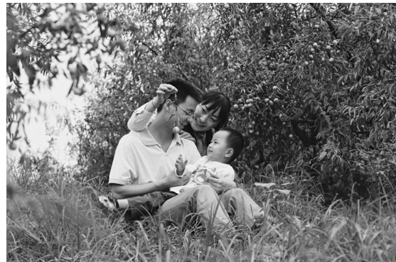
●一家三口自得其乐