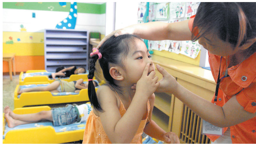
一个小女孩的鼻子里“塞入了异物”，保育员紧急处理。