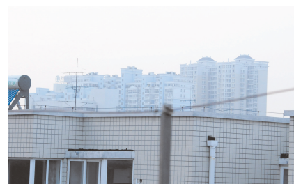
昨日下午，记者在同一位置拍到的楼群。