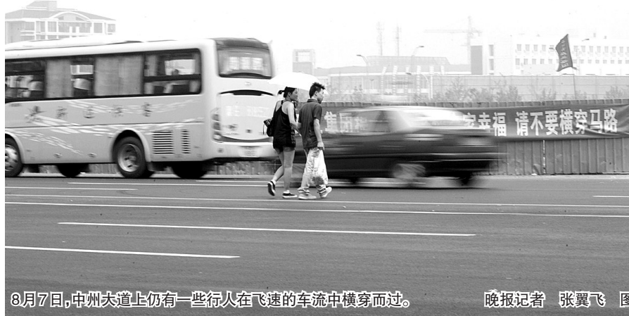
8月7日，中州大道上仍有一些行人在飞速的车流中横穿而过。